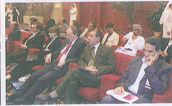
جانب من المشاركين