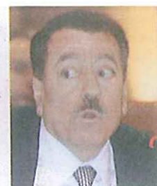
عبد الباري عطوان